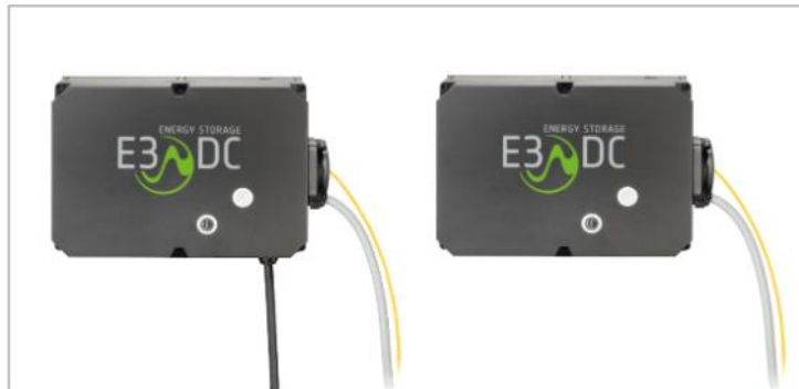
Abb. 25: Verkabelte Wallboxen mit und ohne fest angeschlagenes Ladekabel